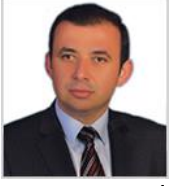
Ahmet ŞAHİN Meclis Başkanı