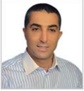
Cengiz ÜNAL Meclis Üyesi