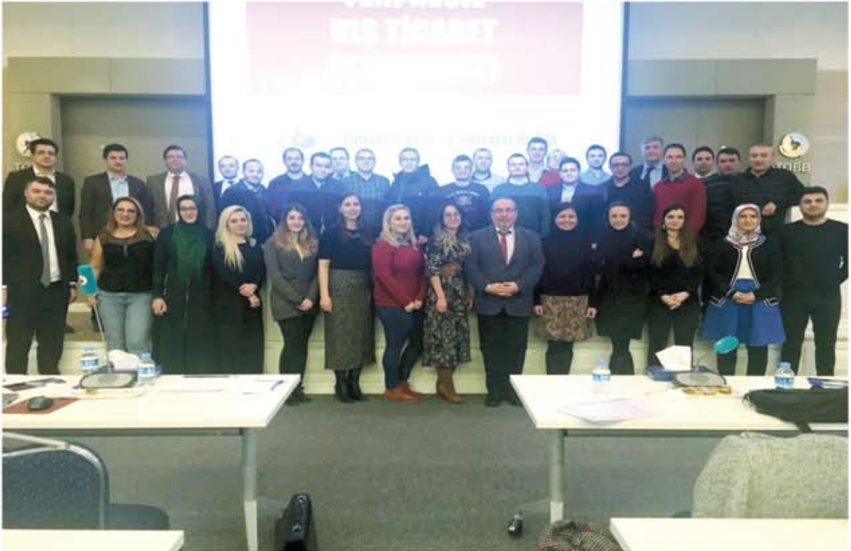
DİŐ TİCARET İŐTİHBARAT EĐİTİMİ