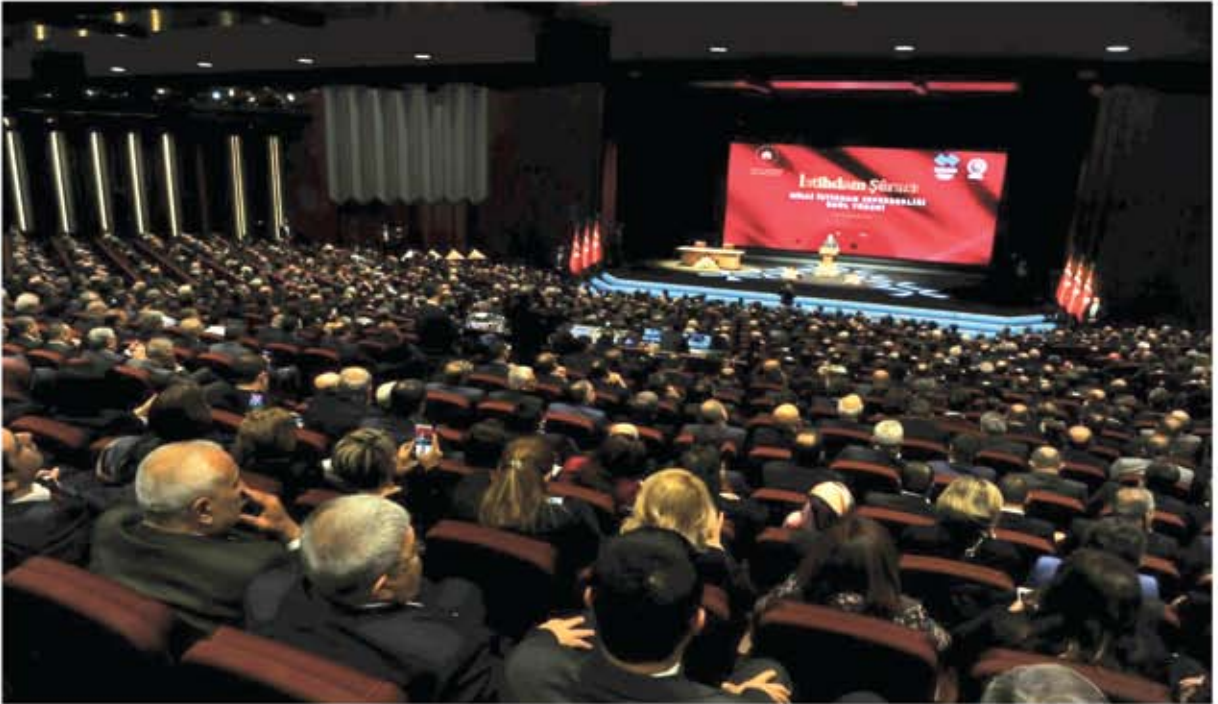
İSTİHDAM ŞURASI ÖDÜL TÖRENİ