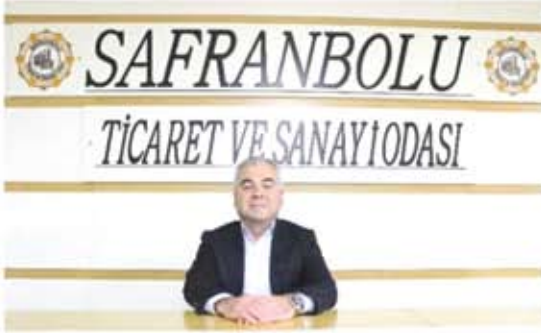
İSMAİL HAYRİ BOYACI MECLİS ÜYESİ