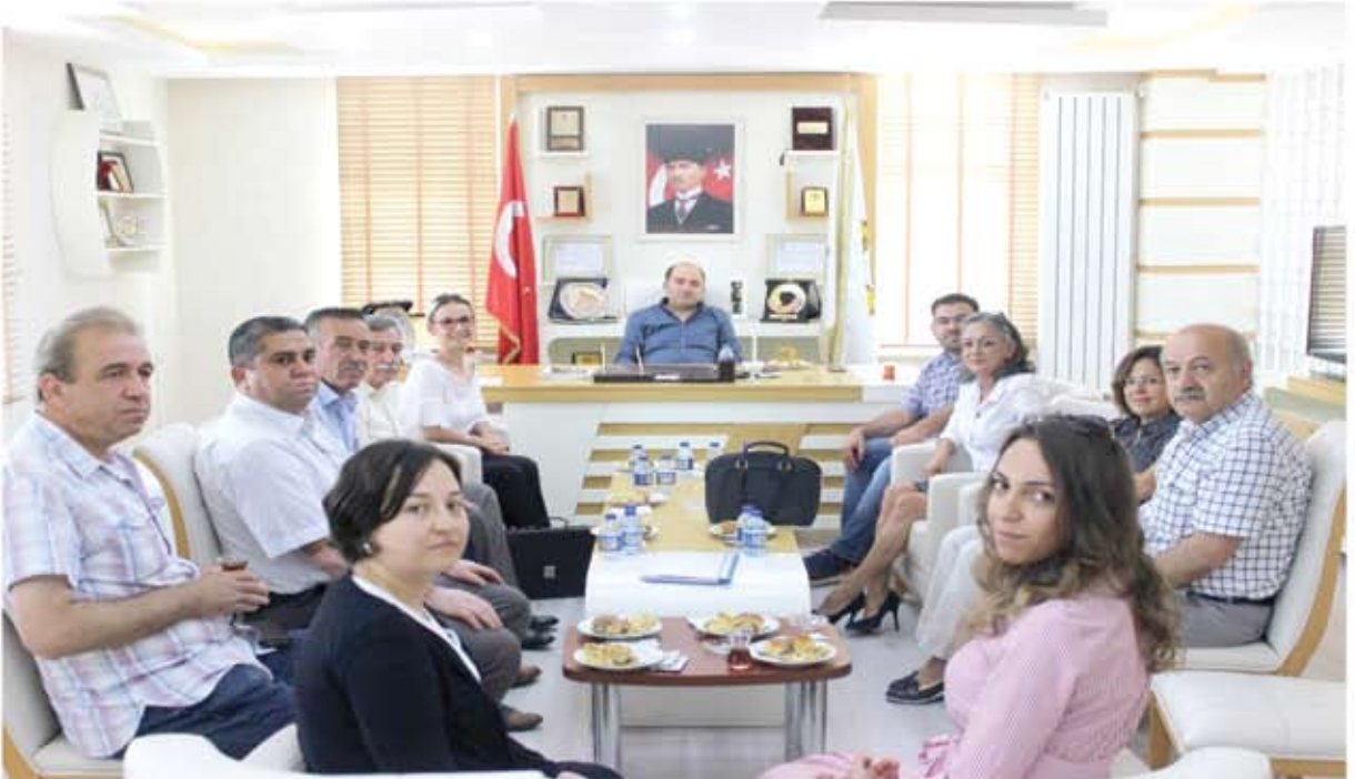
SAFRANBOLU SAFRANI VE LOKUMU COĞRAFİ İŞARET TOPLANTISI