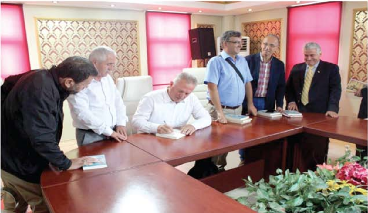
"AÇ KAPIYI BEN GELDİM" ADLI KİTAPIN İMZA GÜNÜ ETKİNLİĞİ