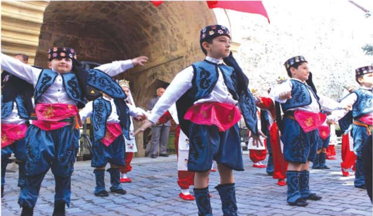
TURİZM HAFTASI ETKİNLİKLERİ