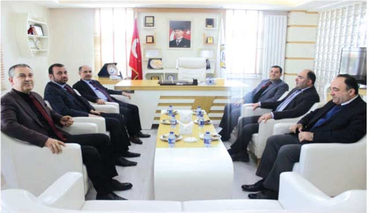
KARABÜK VALİSİ ZİYARETİ