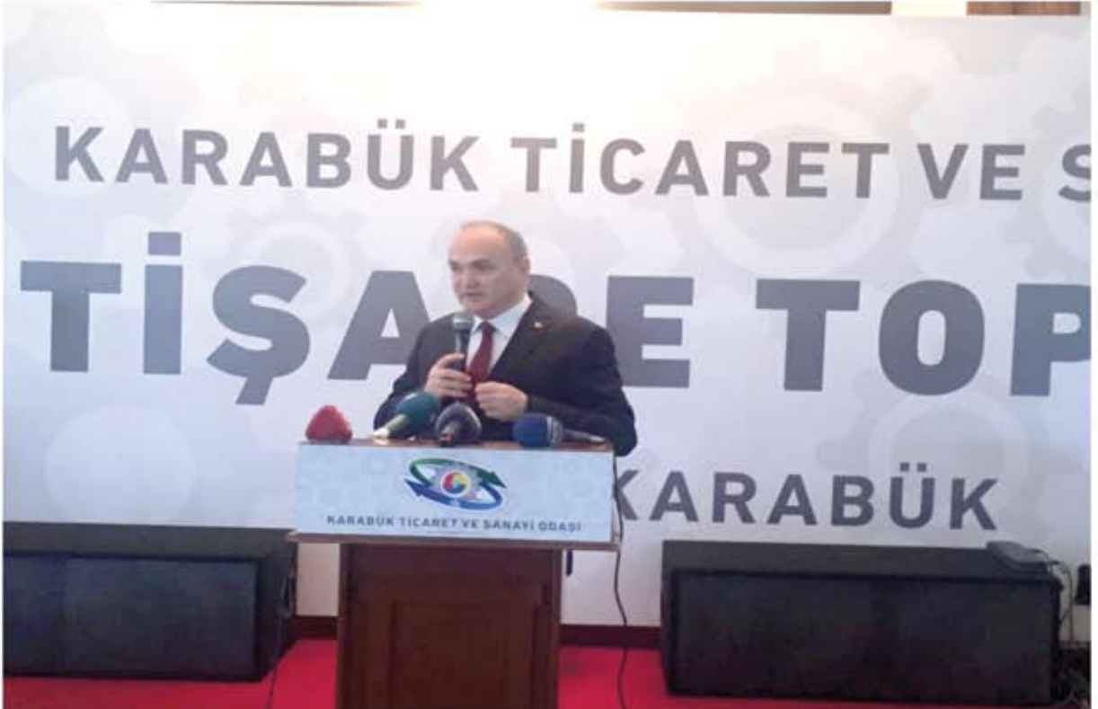
BİLİM SANAYİ VE TEKNOLOJİ BAKANI FARUK ÖZLÜ İLE İŞ ADAMLARI İSTİŞARE TOPLANTISI