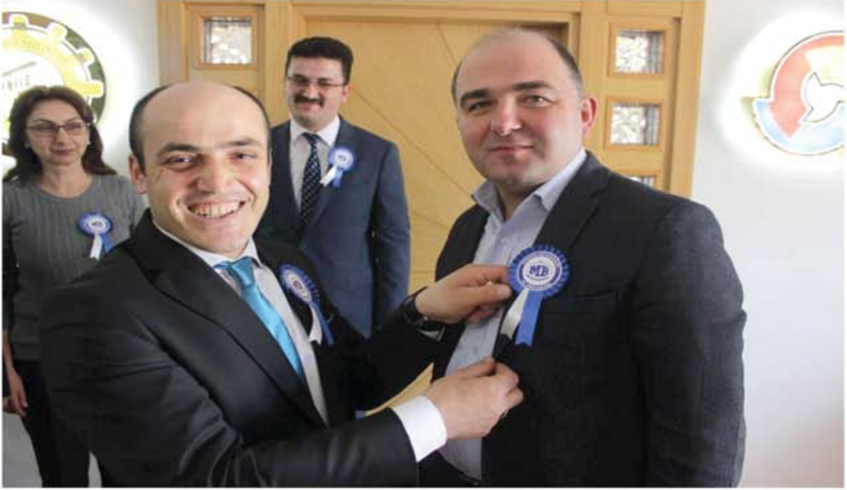
SAFRANBOLU VERGİ DAİRESİ MÜDÜRLÜĞÜ ZİYARETİ