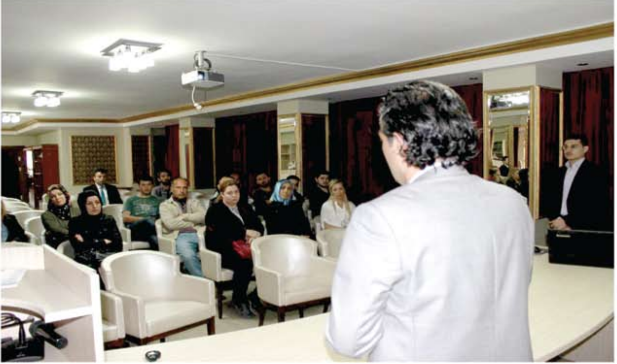
UYGULAMALI GİRİŞİMCİLİK EĞİTİMİ