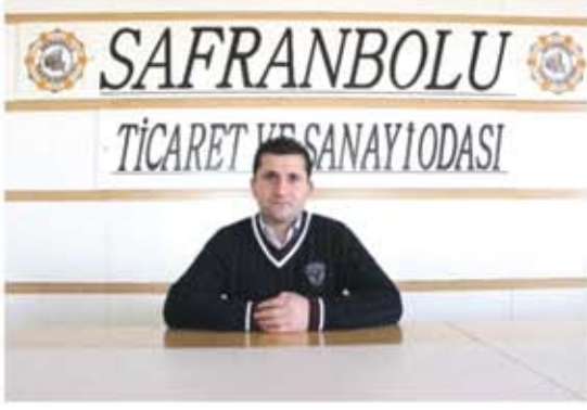
EYÜP ÖZTÜRK MECLİS ÜYESİ