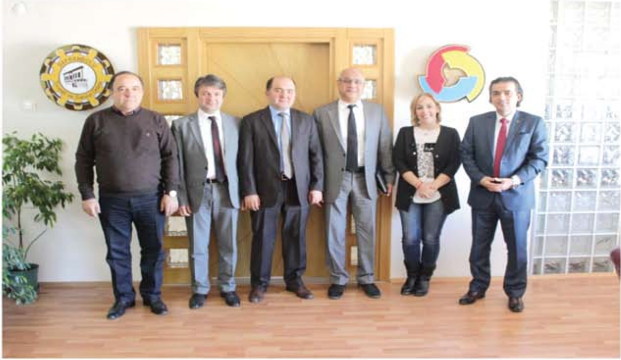
KARABÜK BİLİM SAN VE TEK MD, KARABÜK KOSGEB MÜDÜRÜ ZİYARETİ