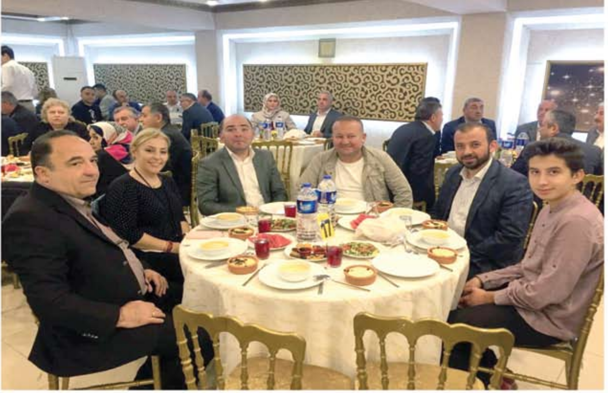
ŞEHİT, GAZİ VE GAZİ YAKINI AİLELERİNE İFTAR YEMEK İKRAMI