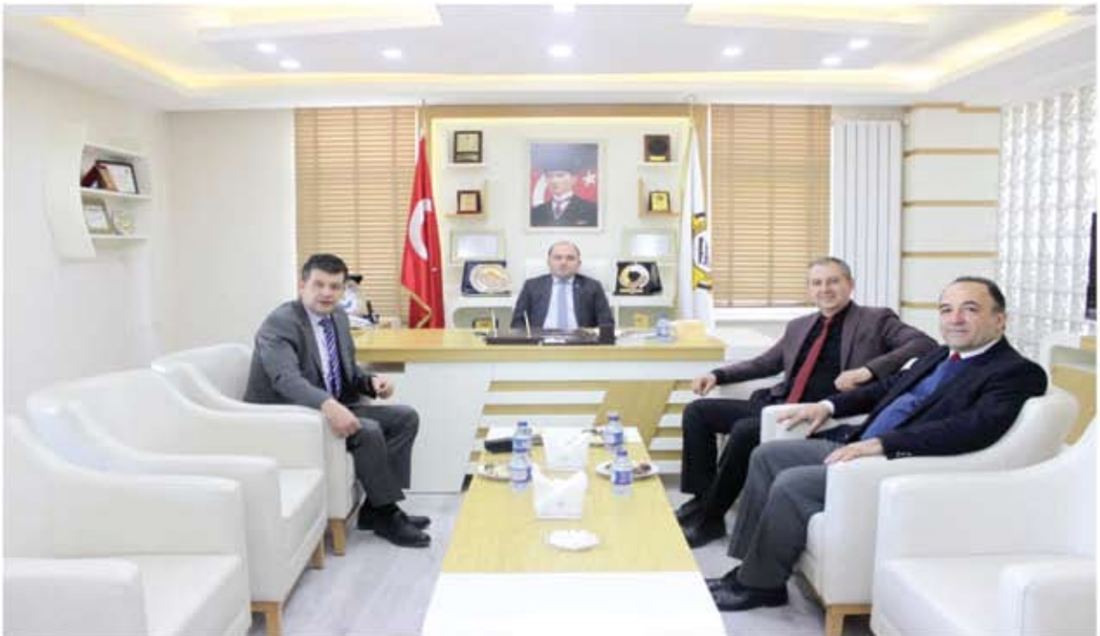
SAFRANBOLU İLÇE EMNİYET MÜDÜRÜ ZİYARETİ