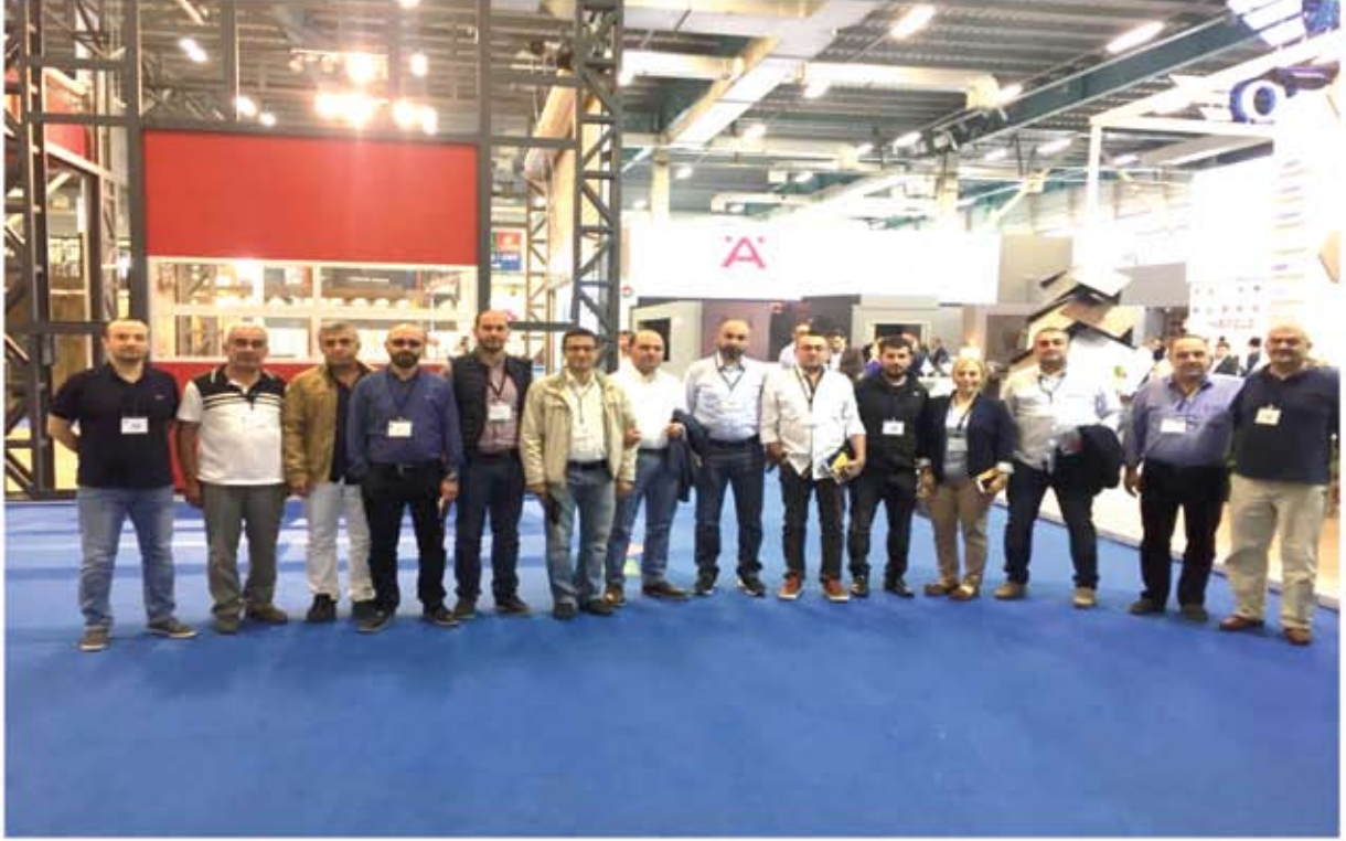
40.Turkeybuild İstanbul Yapı, İnşaat Malzemeleri ve Teknolojileri Fuarı