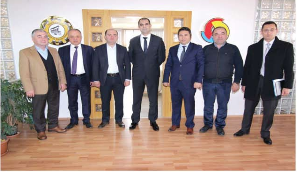
HALKBANK BÖLGE MÜDÜRÜ ZİYARETİ