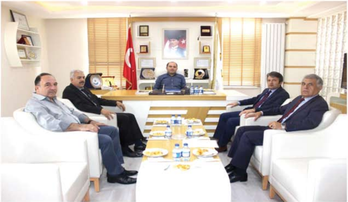
KARABÜK BİLİM SAN. TEK. MD., İL TİCARET MD. VE PLANLAMA MÜDÜRLÜĞÜ ZİYARETİ