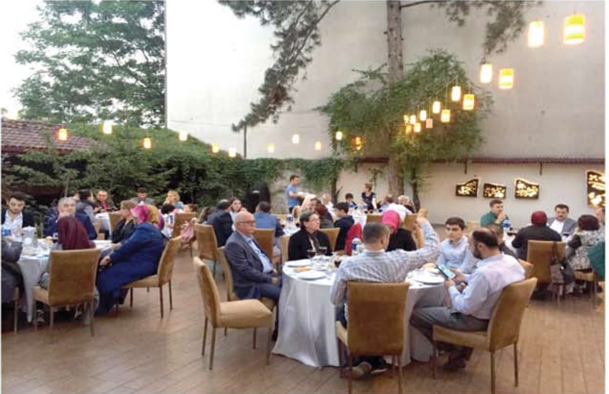
MESLEK KOMİTELERİ ÜYELERİ VE AİLELERİ İLE İFTAR YEMEĞİ