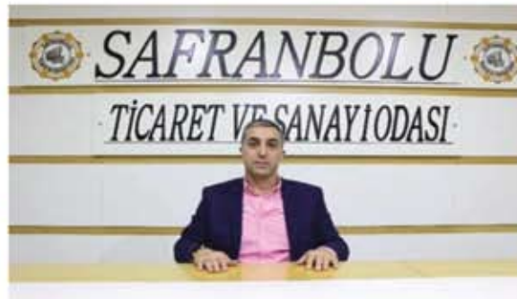
CENGİZ ÜNAL MECLİS ÜYESİ