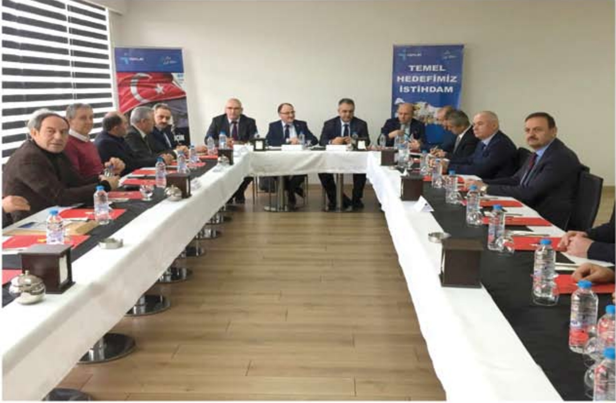
İŞKUR GENEL MÜDÜRÜ İLE İSTİŞARE TOPLANTISI