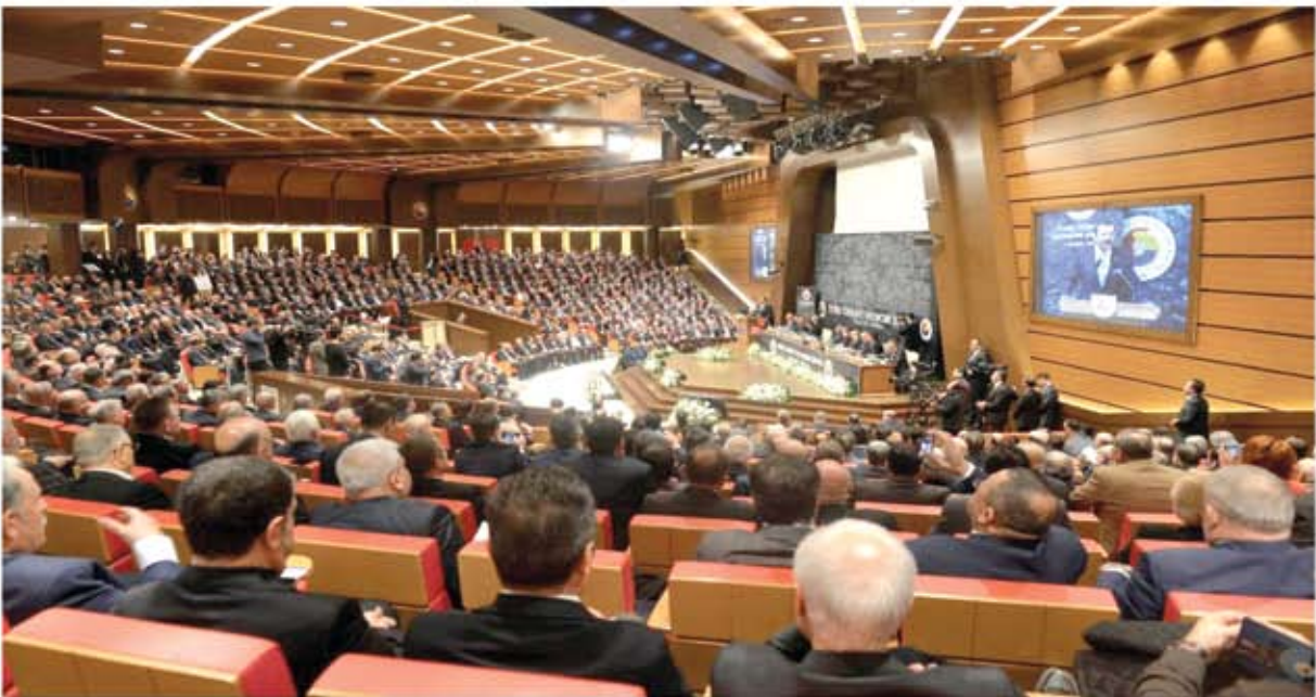
TÜRKİYE TİCARET ŞURASI