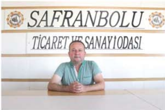
METİN ÇAKIR MECLİS ÜYESİ