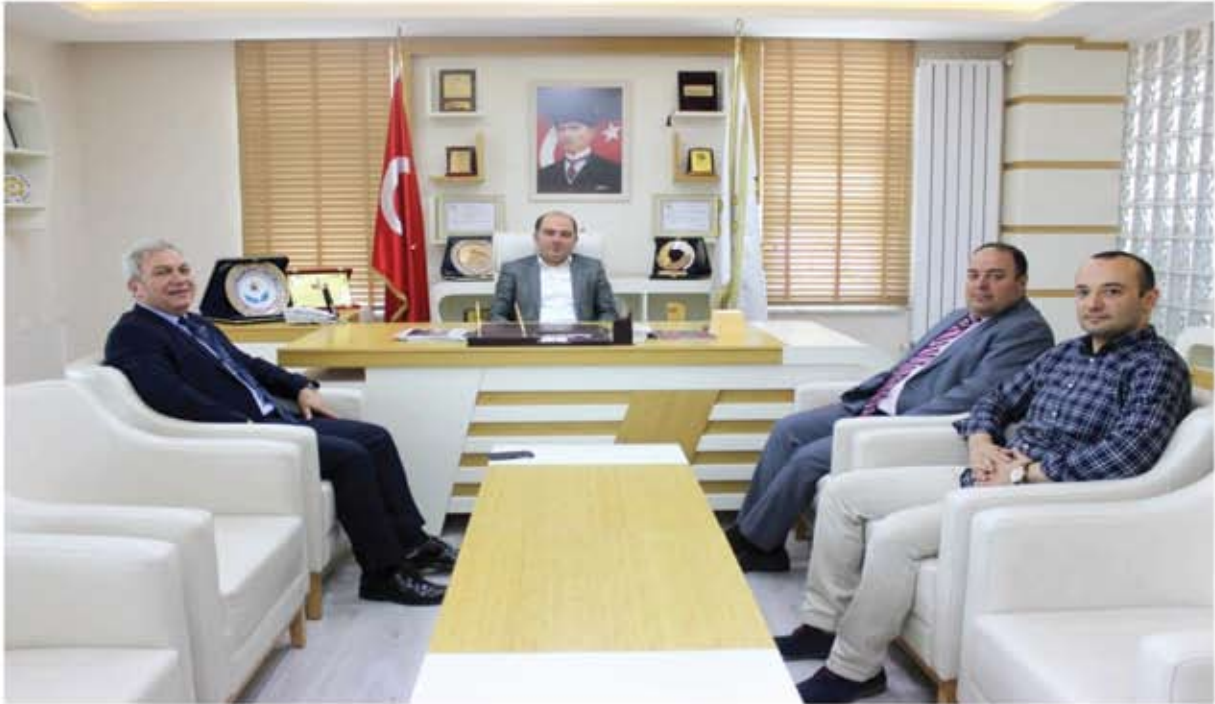
TOBB ODALAR BORSALAR DAİRE BAŞKANI HASAN ERBAY ZİYARETİ