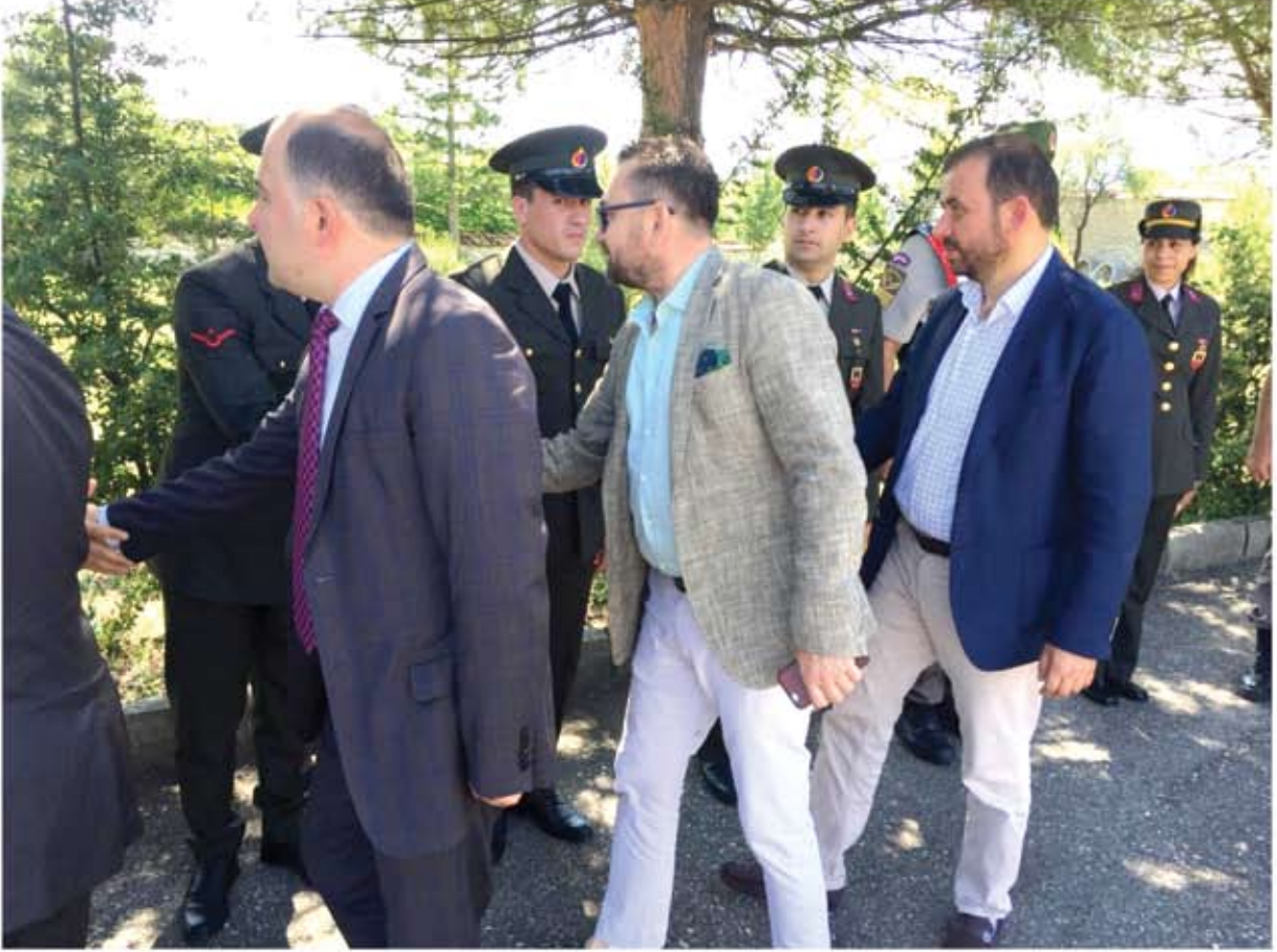
RAMAZAN BAYRAMI BAYRAMLAŞMA TÖRENİ