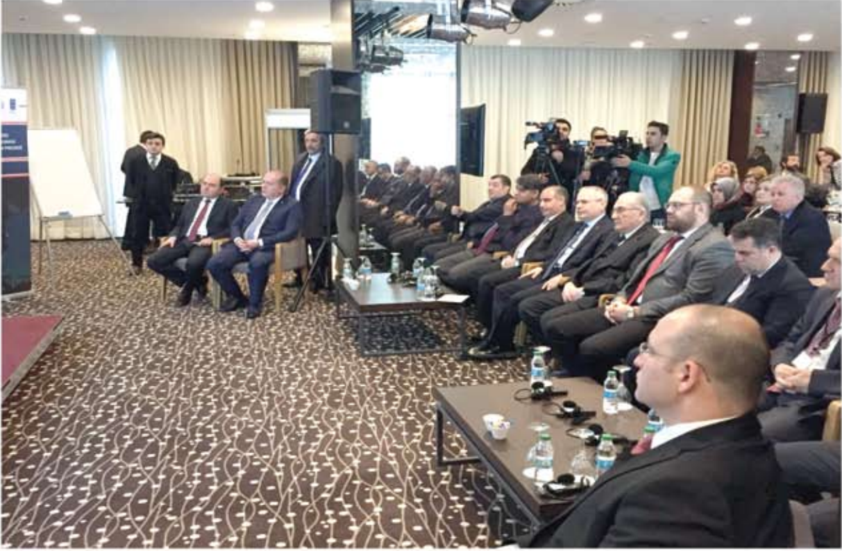
KALICI ORGANİK KİRLİTİCİ (KOK) STOKLARININ ORTADAN KALDIRILMASI PROJE TOPLANTISI