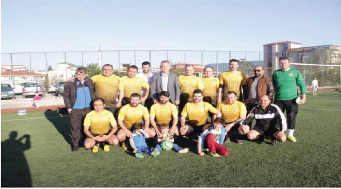
4.KURUMLAR ARASI ALTIN SAFRAN FUTBOL TURNUVASINA KATILDIK