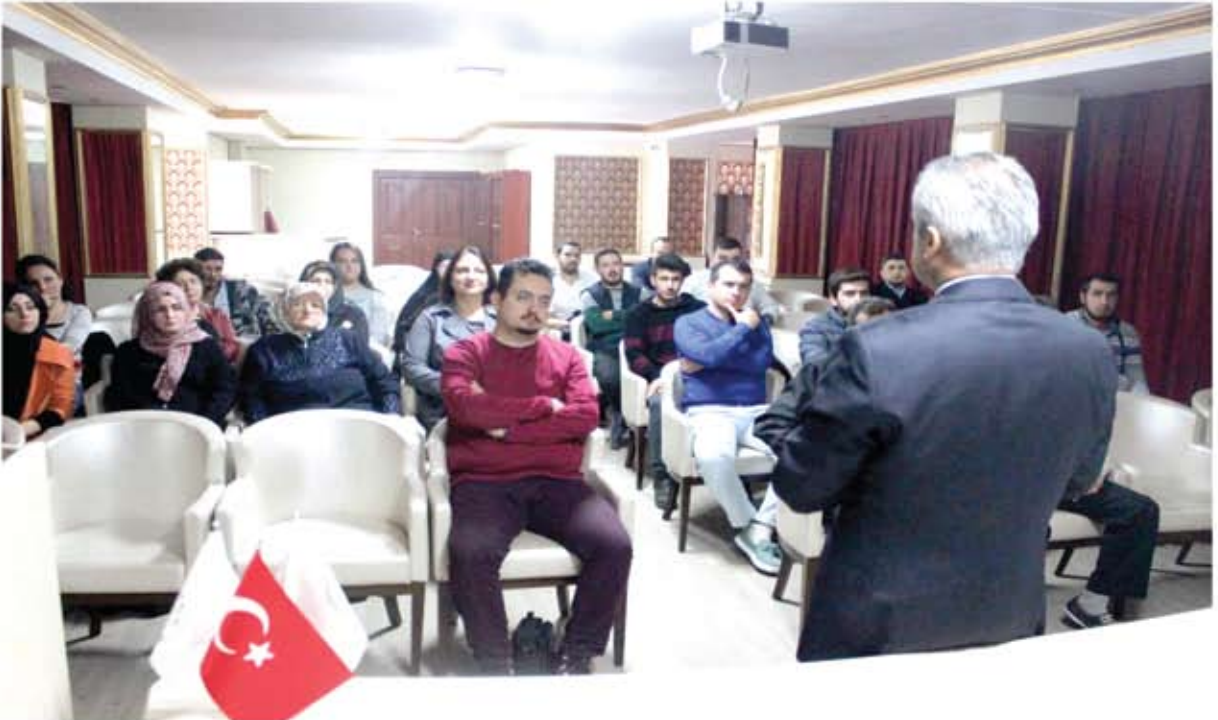
UYGULAMALI GİRİŞİMCİLİK EĞİTİMİ