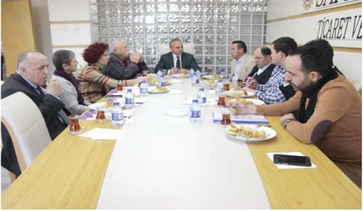
KENT KONSEYİ YÜRÜTME KURULU TOPLANTISI