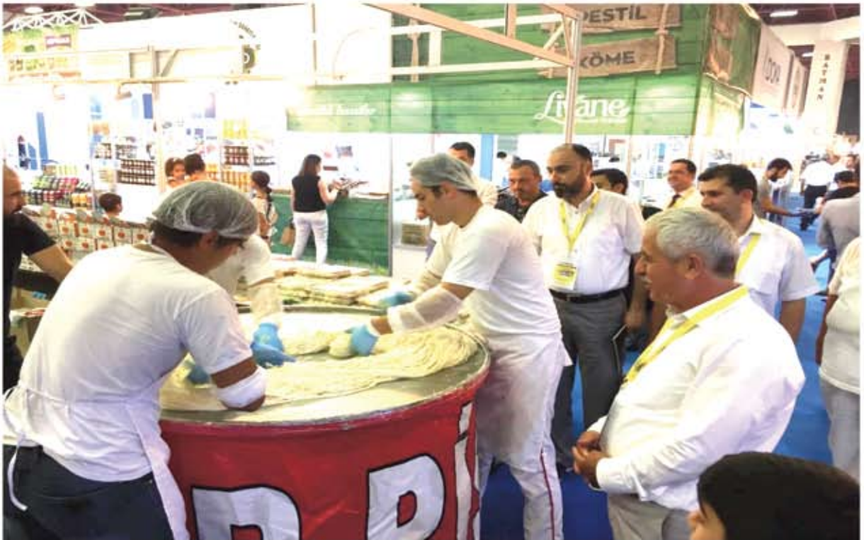
8. YÖRESEL ÜRÜNLER FUARI (YÖREX)