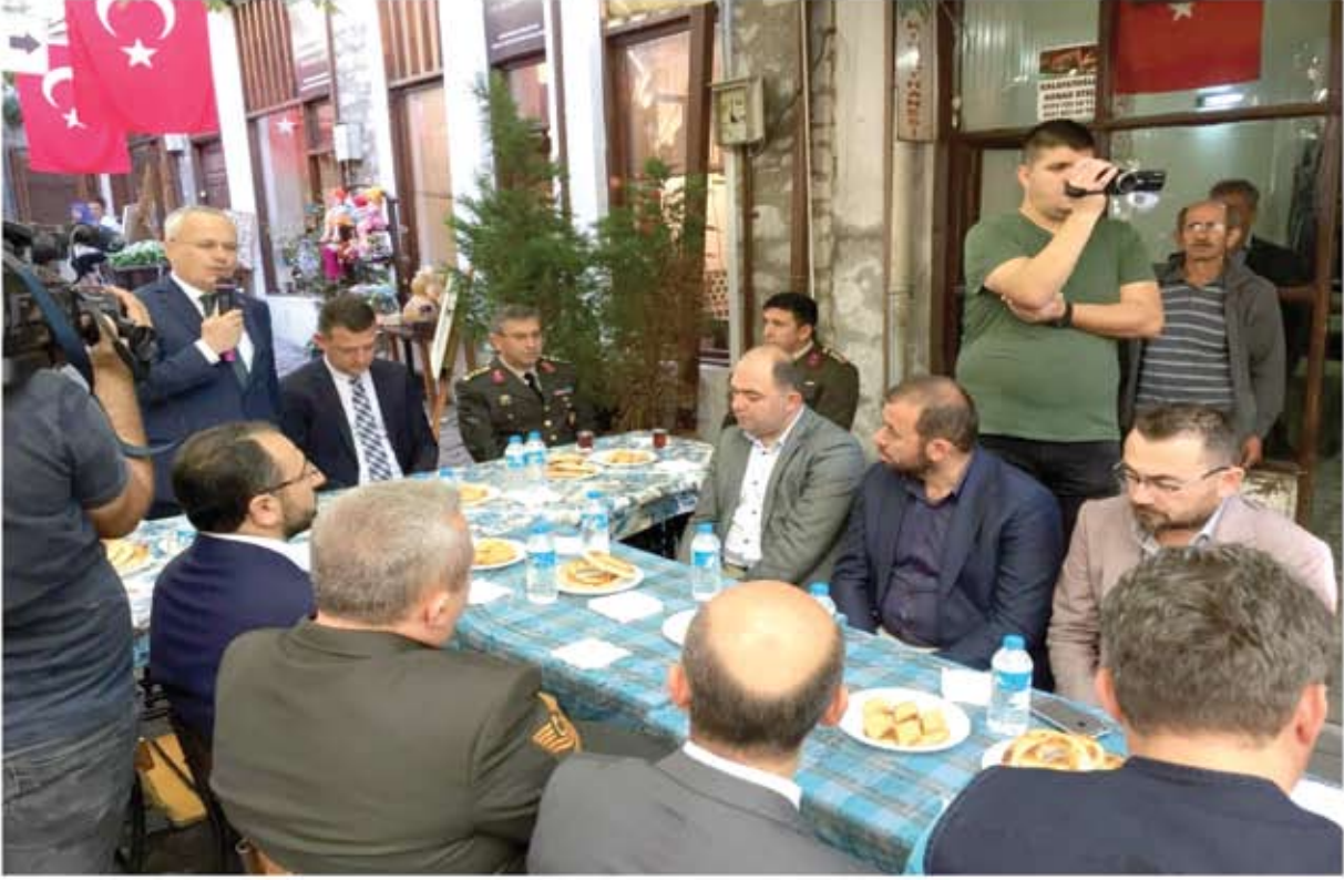
KURBAN BAYRAMI BAYRAMLAŞMA TÖRENİ