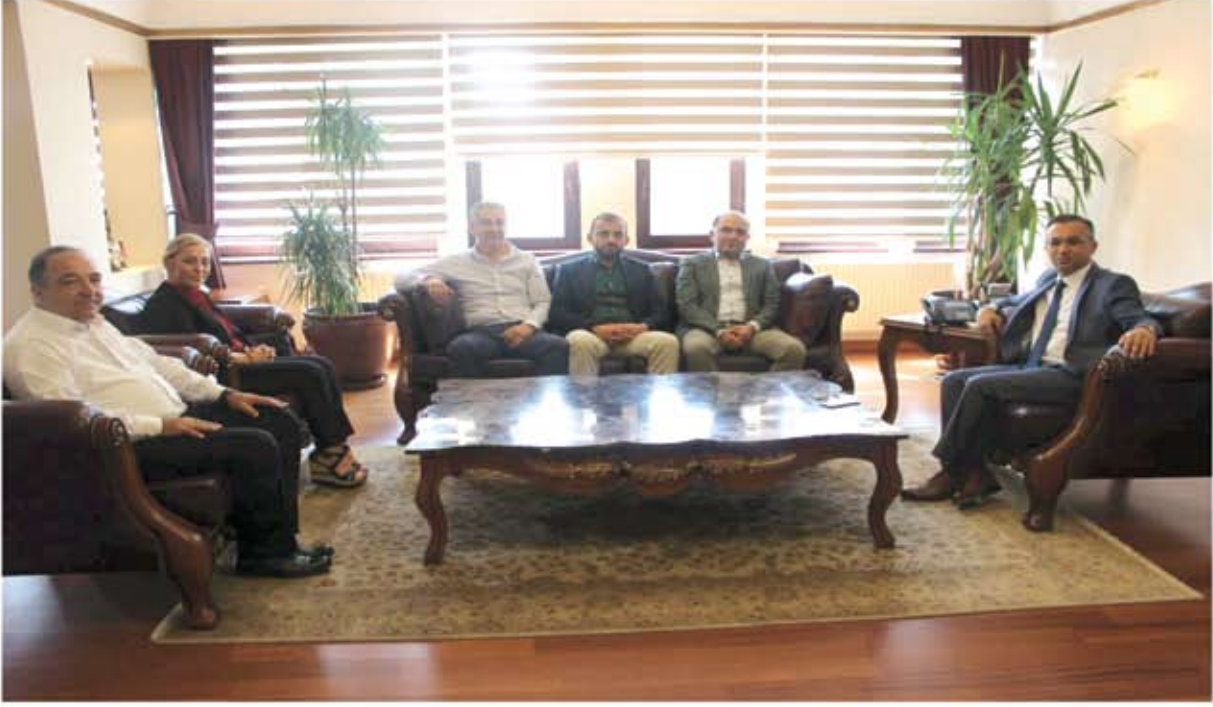
KARABÜK VALİLİĞİ ZİYARETİ