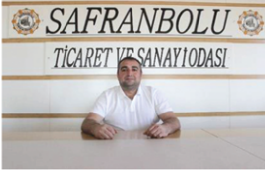
ÖMER ÖZLER MECLİS ÜYESİ