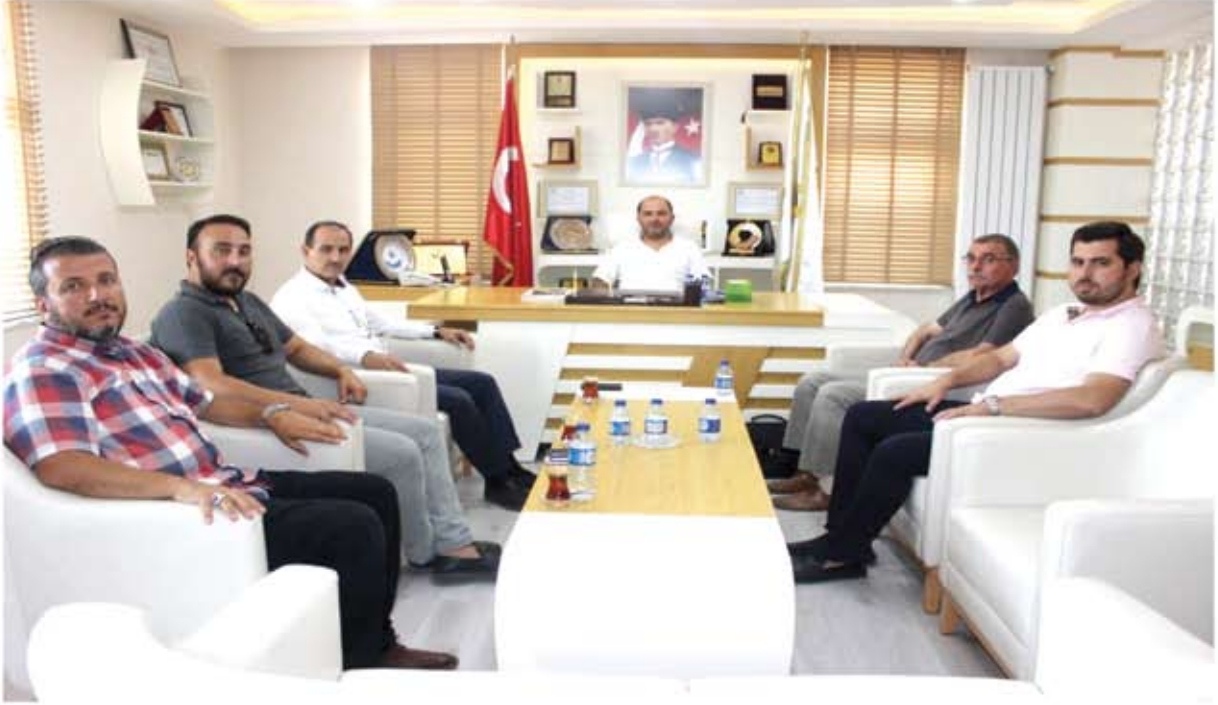
MHP SAFRANBOLU İLÇE BAŞKANLIĞI ZİYARETİ