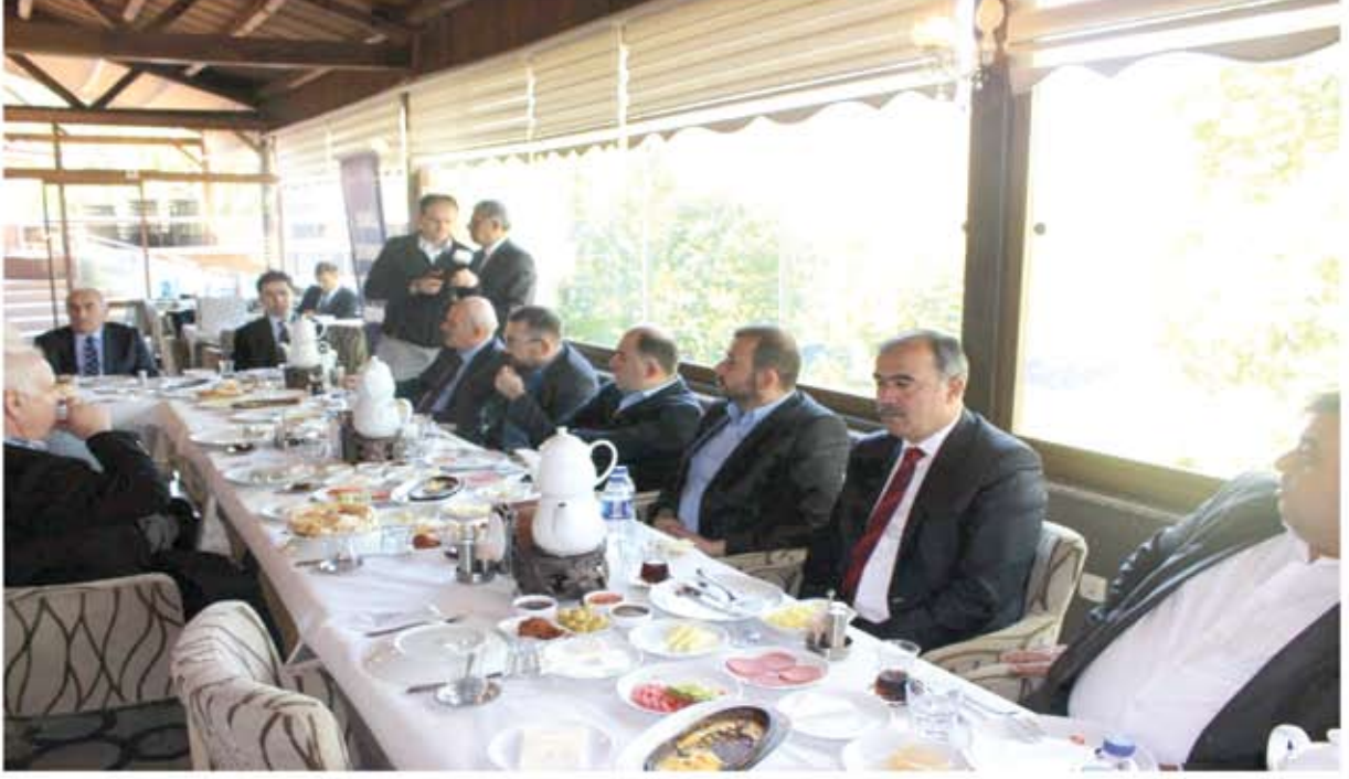
KARABÜK VALİSİ VE İŞ ADAMLARI İLE İSTİŞARE TOPLANTISI