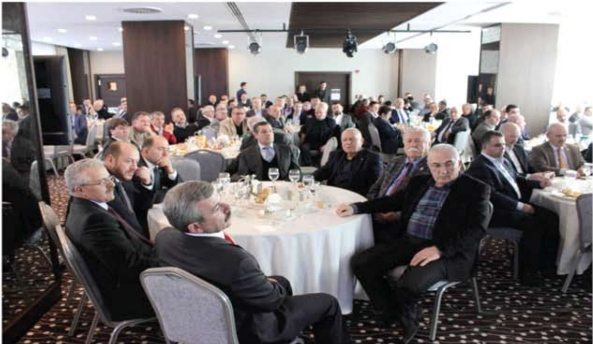
KARABÜK VALİSİ VE SANAYİCİ İŞ ADAMLARI İLE TOPLANTI