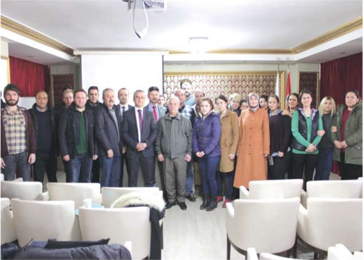
UYGULAMALI GİRİŞİMCİLİK EĞİTİMİ