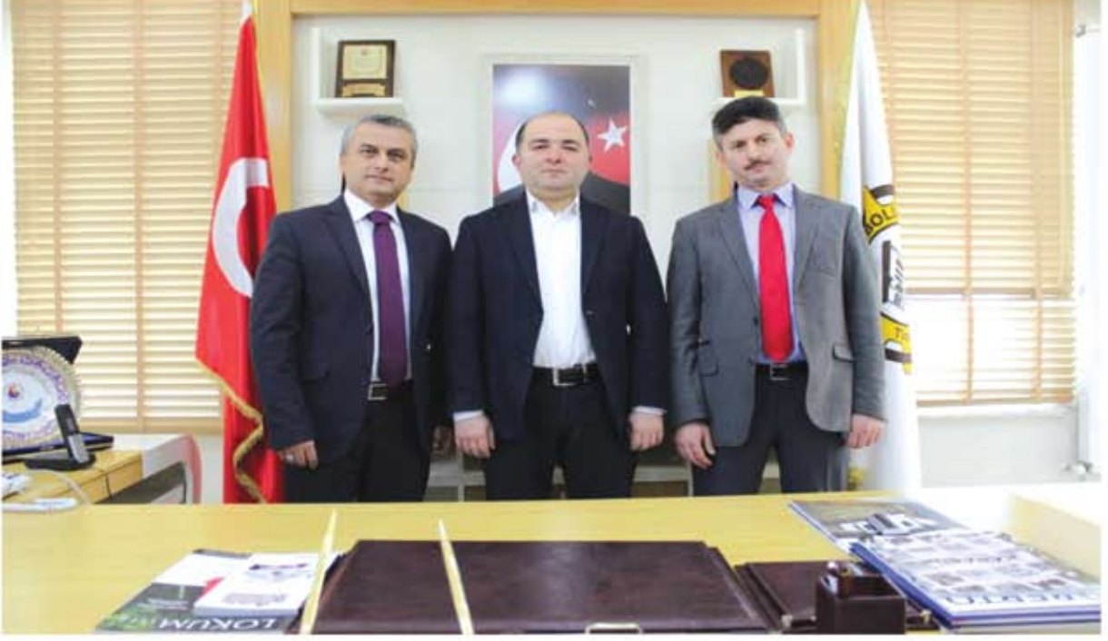
KARABÜK İŞKUR MÜDÜRÜ VE BAKKA YDO ZİYARETİ