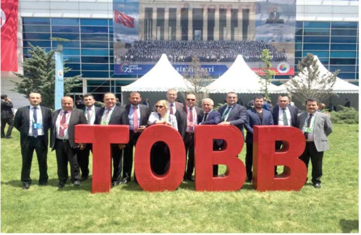
TOBB 73. GENEL KURULU