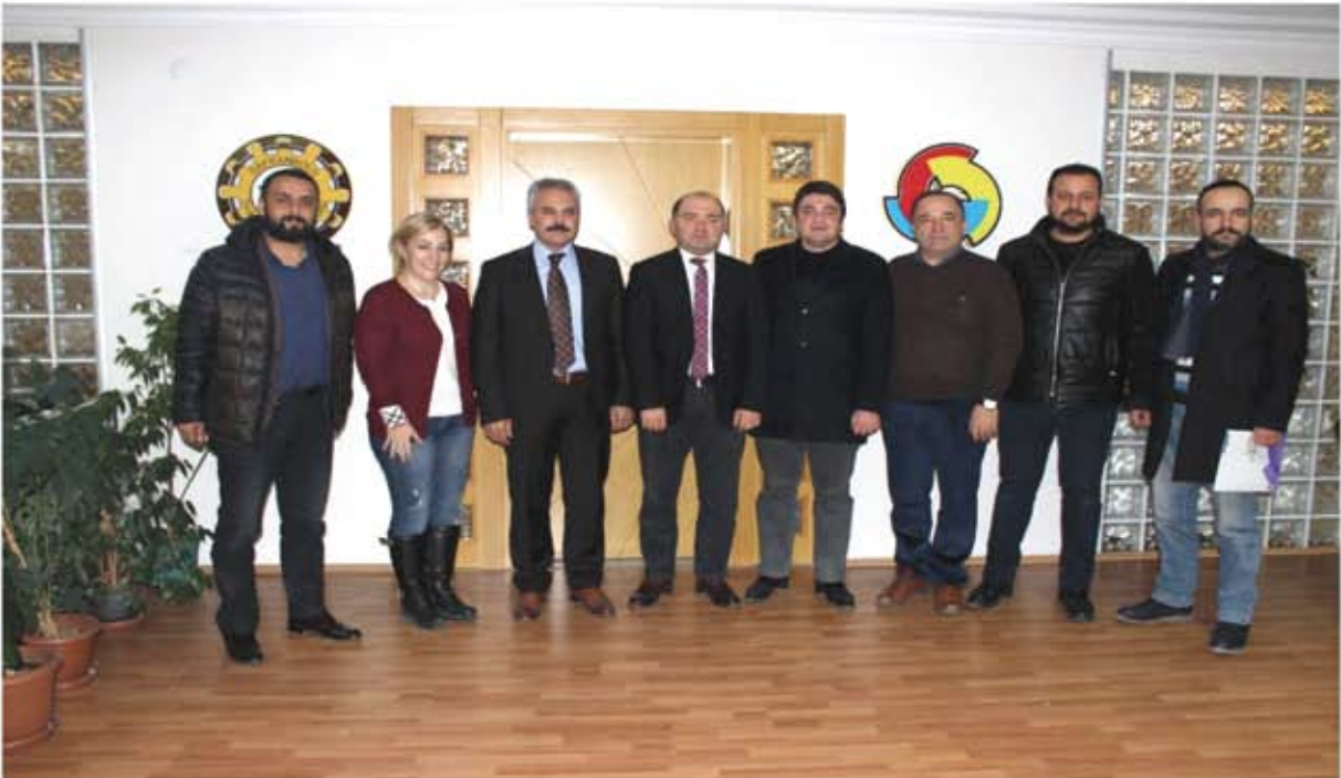
KARABÜK MİLLETVEKİLİ PROF.DR. BURHANETTİN UYSAL ZİYARETİ