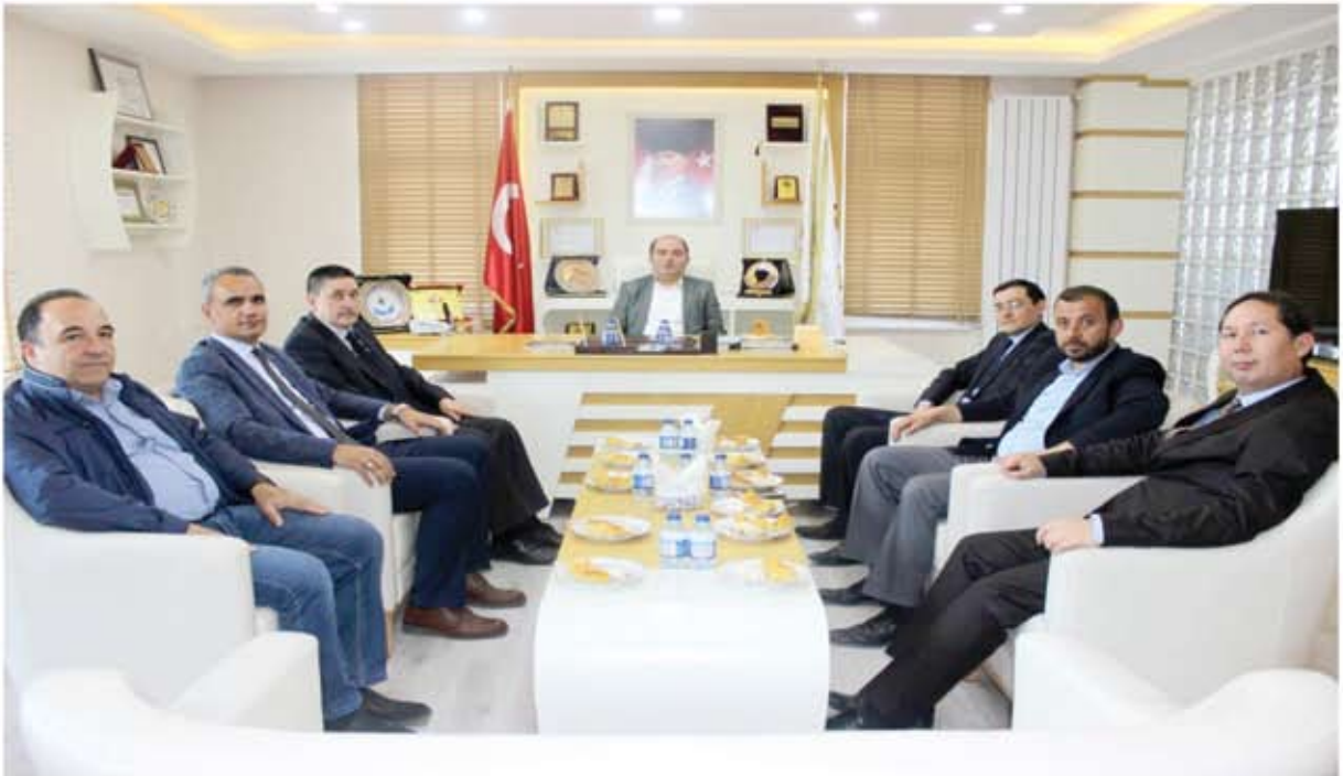
ÖZBEKİSTAN ANKARA BÜYÜKELÇİSİ İLE TOPLANTI