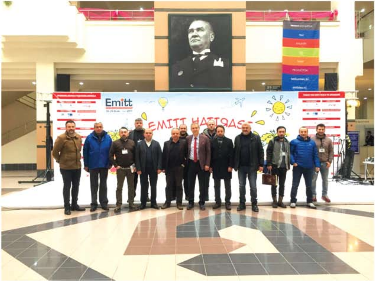
23. DOĞU AKDENİZ ULUSLARARASI TURİZM VE SEYAHAT FUARI (EMİTT)