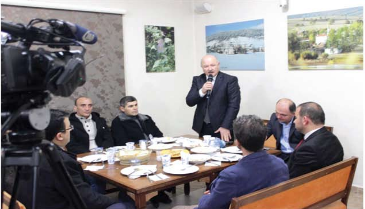
EFLANİ'DE FAALİYET GÖSTEREN ÜYELERİMİZLE İSTİŞARE TOPLANTISI