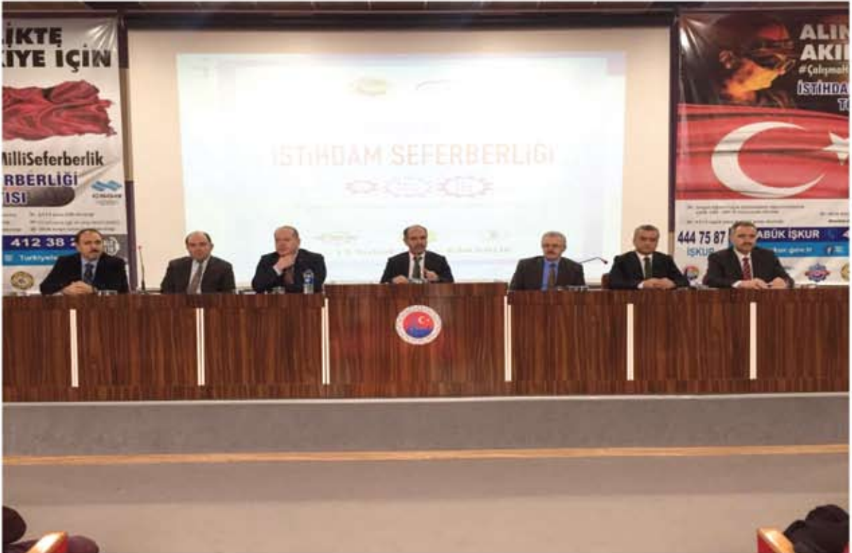
ÇALIŞMA HAYATINDA MİLLİ İSTİHBARAT SEFERBERLİĞİ TOPLANTISI