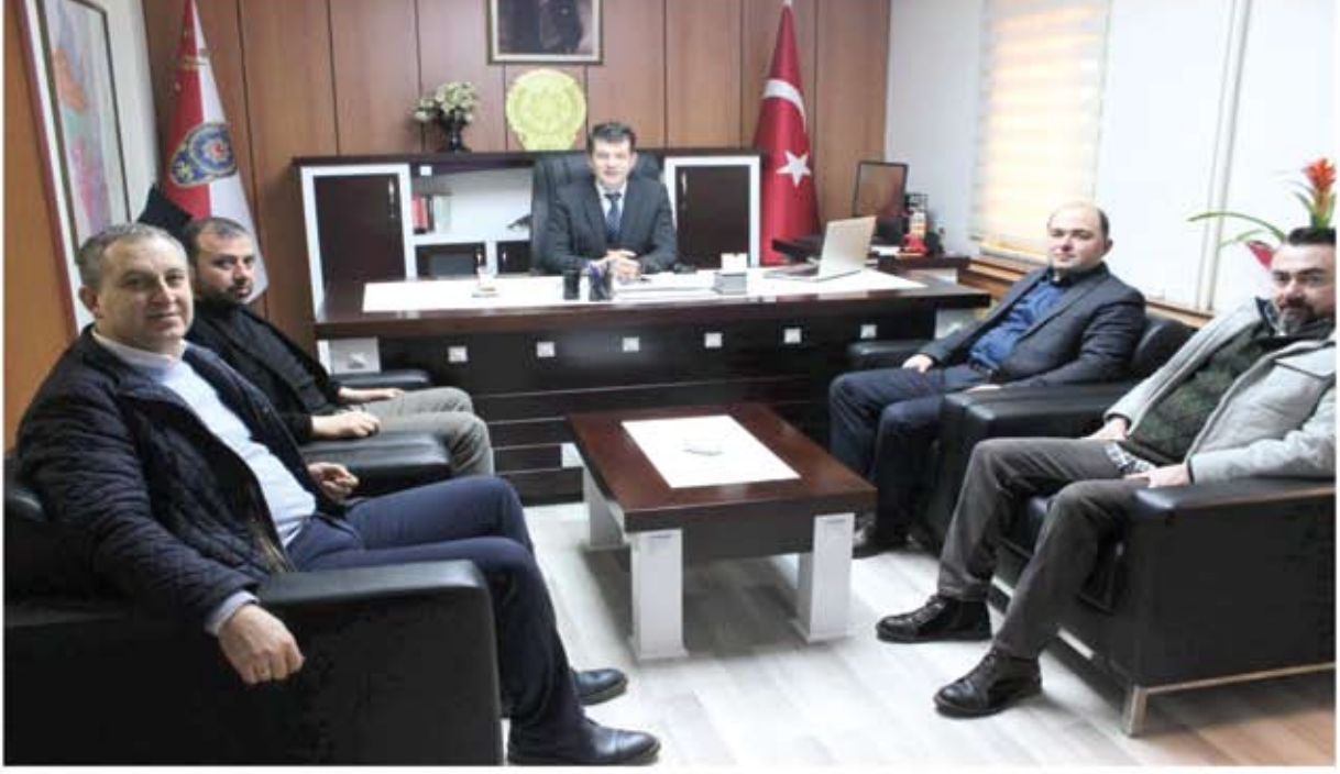
SAFRANBOLU İLÇE EMNİYET MÜDÜRLÜĞÜ ZİYARETİ