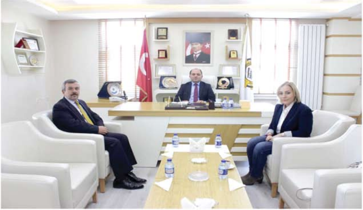
KARABÜK İL EMNİYET MÜDÜRÜ ZİYARETİ