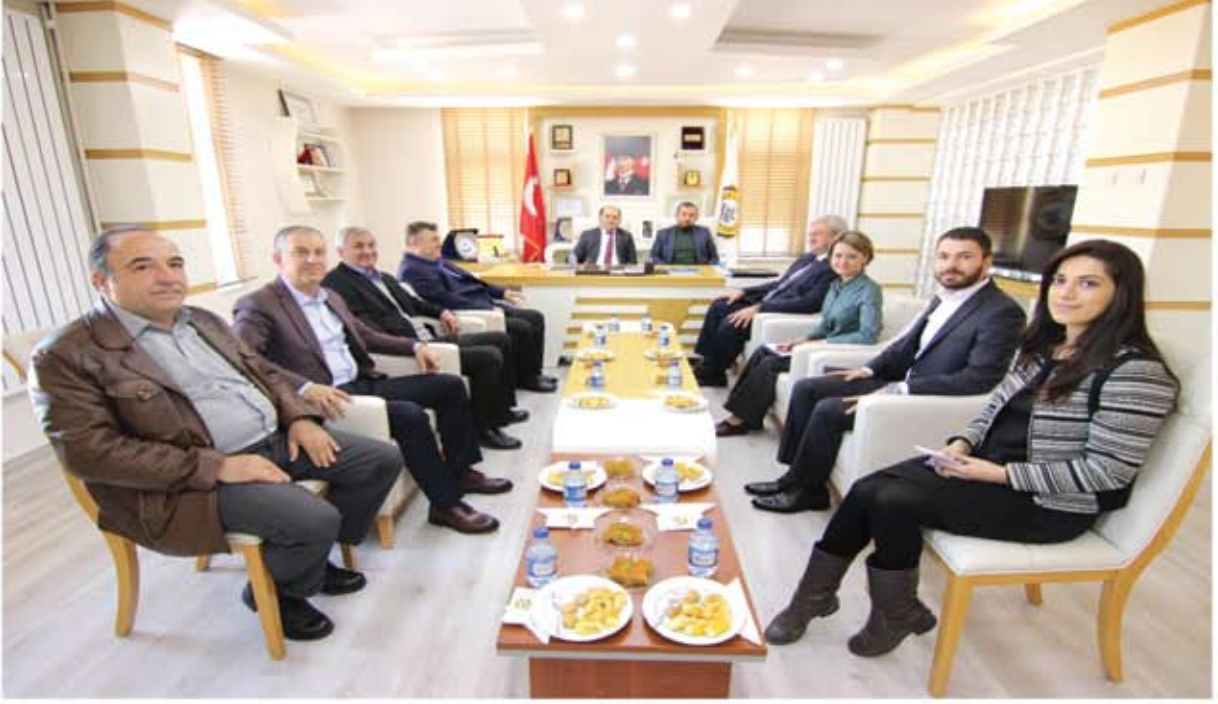
UKRAYNA ANKARA BÜYÜKELÇİSİ İLE TOPLANTI