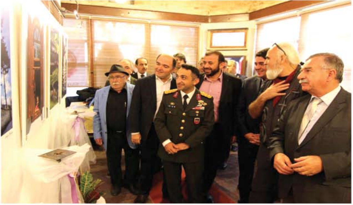
İŞİĞİN İZİNDE SAFRANBOLU AFLI FOTOĞRAF SERGİSİ