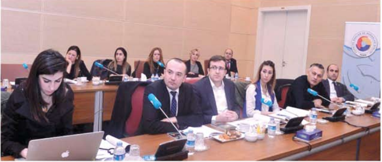
ULUSLARARASI REKABETÇİĞİ GELİŞTİRME EĞİTİMİ