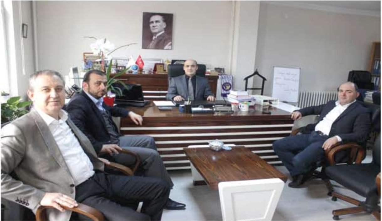
SAFRANBOLU VERGİ DAİRESİ MÜDÜRLÜĞÜ ZİYARETİ